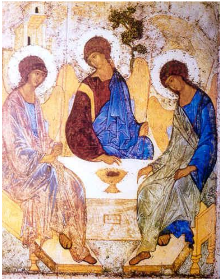
La Trinidad (Andrei Rublev)