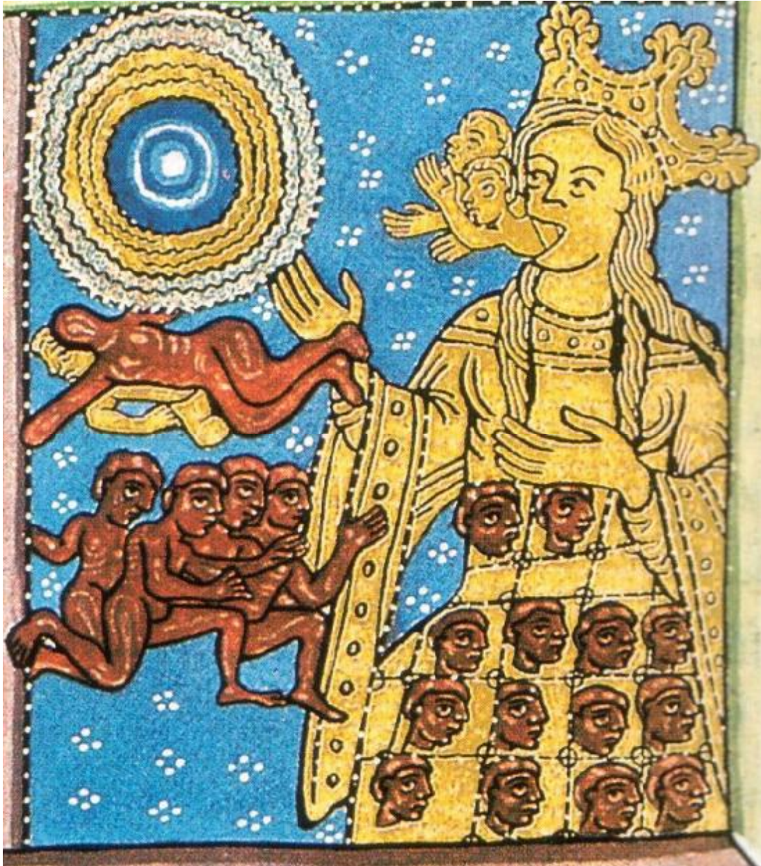
La Iglesia ( Scivias 2, 3, detalle)