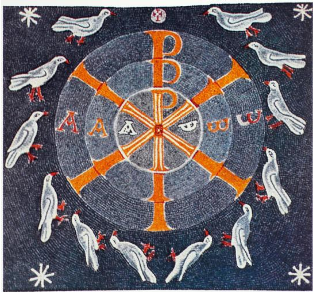
Mosaico del baptisterio de Albenga (Etruria)